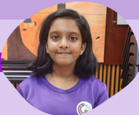
மயுக்கா (5 RE)

அவசரக் காலங்களில் செய்யவேண்டியவற்றை நன்கு அறிந்துகொள்வேன். மேலும், குடிமைத் தற்காப்பு ஏற்பாடு செய்யும் அவசரக் காலப் பாவனைப்பயிற்சிகளில் நான் ஆர்வத்துடன் பங்கேற்பேன். அதோடு, மற்றவர்களுக்கு முதலுதவி செய்யக் கற்றுக்கொள்ளவேன்.