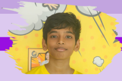
விக்காஸ் (5 RY)